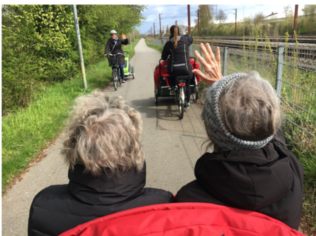
Cykeltur gennem Roskilde