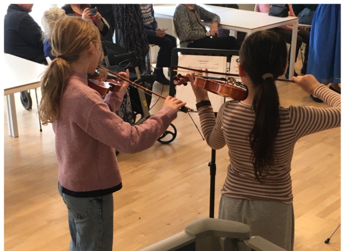
Violin koncert i Caféen med børn fra Roskilde Kunstscole