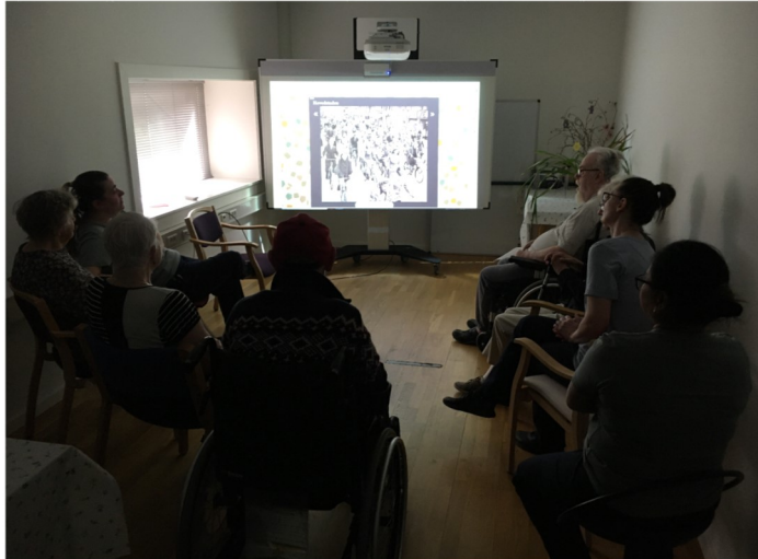
Digitale Erindringskasser og snak