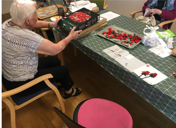
Der bygges legobloster