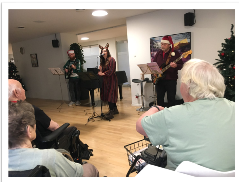
Frøken Flormelis og Æbleskiverne i cafeen sidste år

Bagge-Hansen Trio kan opleves i caféen den 1.maj kl. 11